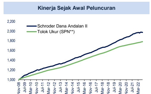
Grafik kinerja dihitung dengan mengikutsertakan dividen yang direinvestasikan.

INFORMASI LEBIH LENGKAP DAPAT DILIHAT DI PROSPEKTUS YANG DAPAT DI AKSES DI WWW.SCHRODERS.CO.ID