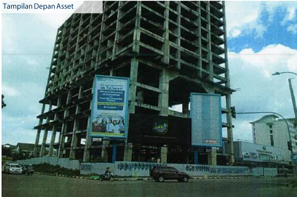
Tampilan Depan Asset